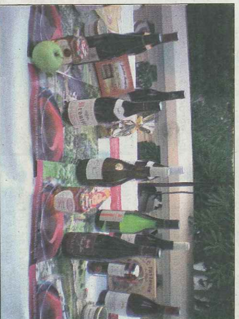
Le beaujolais, représenté à Rimini, devrait aller jusqu'à Shanghai lors de l'exposition universelle.

et internationaux. Dans ce cadre, le cluster beaujolais a de fortes chances d'être présent à l'exposition universelle qui se tient à Shanghai, du 1 er mai au 10 octobre 2010. "Ce sera l'occasion de mettre en valeur notre territoire" , annonce Sophie Landreau. Laurence Chopart