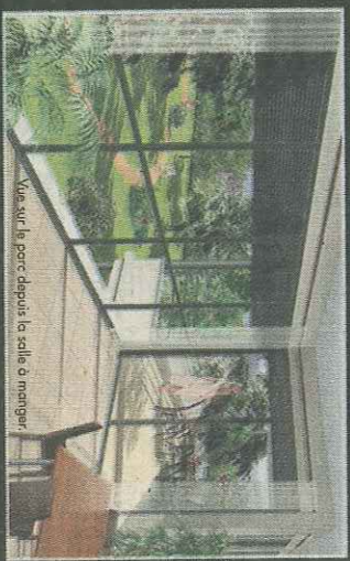
Vue sur le parc depuis la salle à manger

(Image à caractère d'annonce non contrôlée)