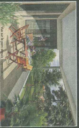
Vue sur le parc depuis la terrasse